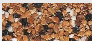
MAR2 M058 HBW 16