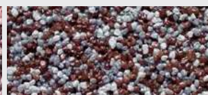
DE SA CGZZ HBW 18,5