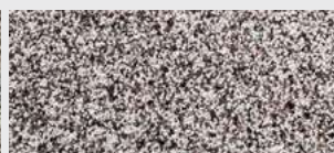
DE ST 10 HBW 29,1