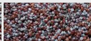
DE SA OGZZ HBW 15,2

Pro lepší představu skutečné barevnosti navštivte stavebniny a vyžádejte si vzorník.