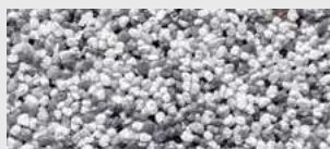
DE SA KKGC HBW 34,2