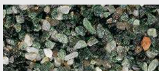
MAR2 M043 HBW 15