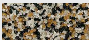
MAR2 0038 HBW 19