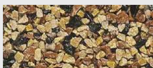
MAR2 M052 HBW 21