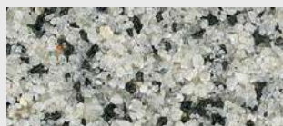
MAR1 0040 HBW 32