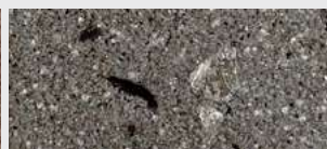
DE ST 06 HBW 11,8