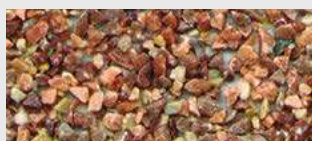
MAR2 M103 HBW 18