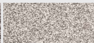
DE ST 11 HBW 33,4