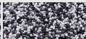
DE SA OOKC HBW 27,6