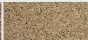
DE ST 04 HBW 24,2