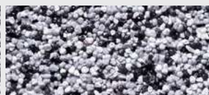
DE SA OKCC HBW 23,8