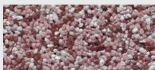
DE SA KRRL HBW 29,8