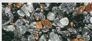
MAR3 M203 HBW 15