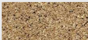
DE ST 01 HBW 22,4