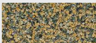
MAR1 M024 HBW 19