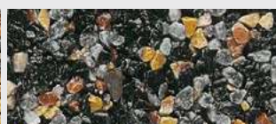
MAR2 M053 HBW 11