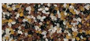
MAR2 0037 HBW 14