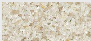
MAR2 0077 HBW 48