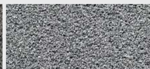
DE ST 08 HBW 18,6