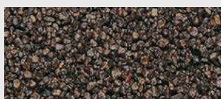
MAR2 M091 HBW 7