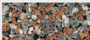
MAR2 M059 HBW 21