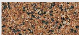
MAR1 M074 HBW 17